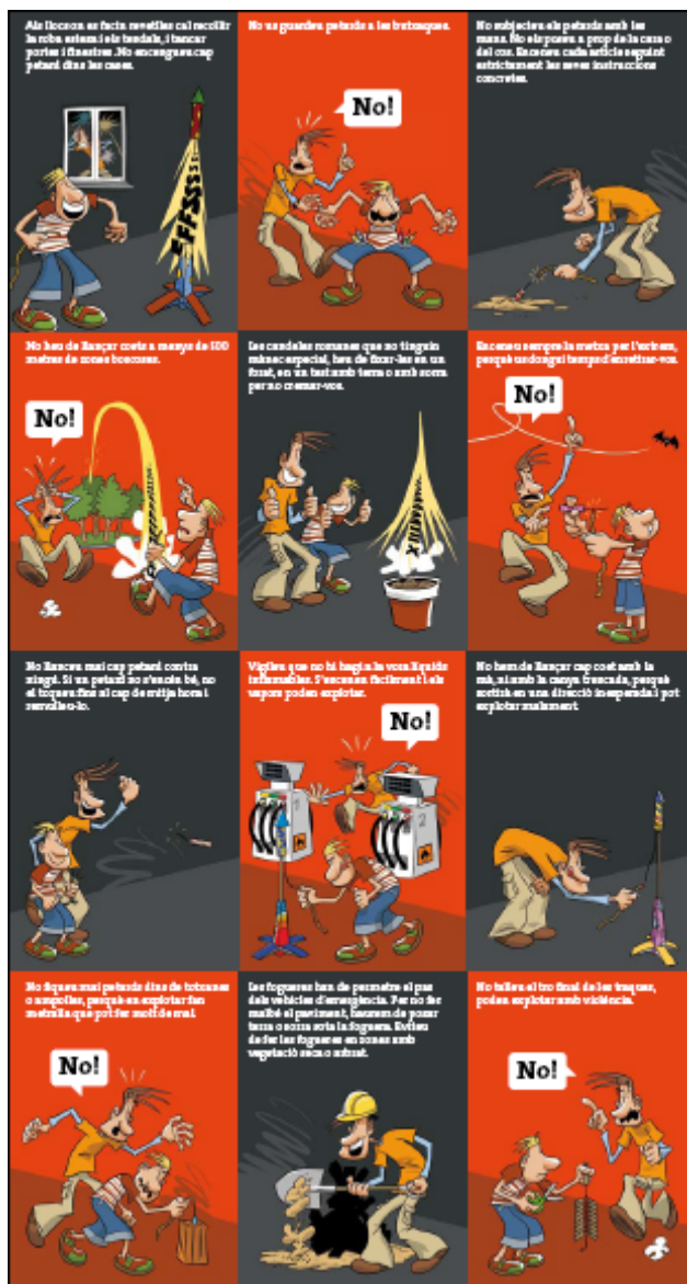
Imatges d'un dels quadríptics que s'han distribuït